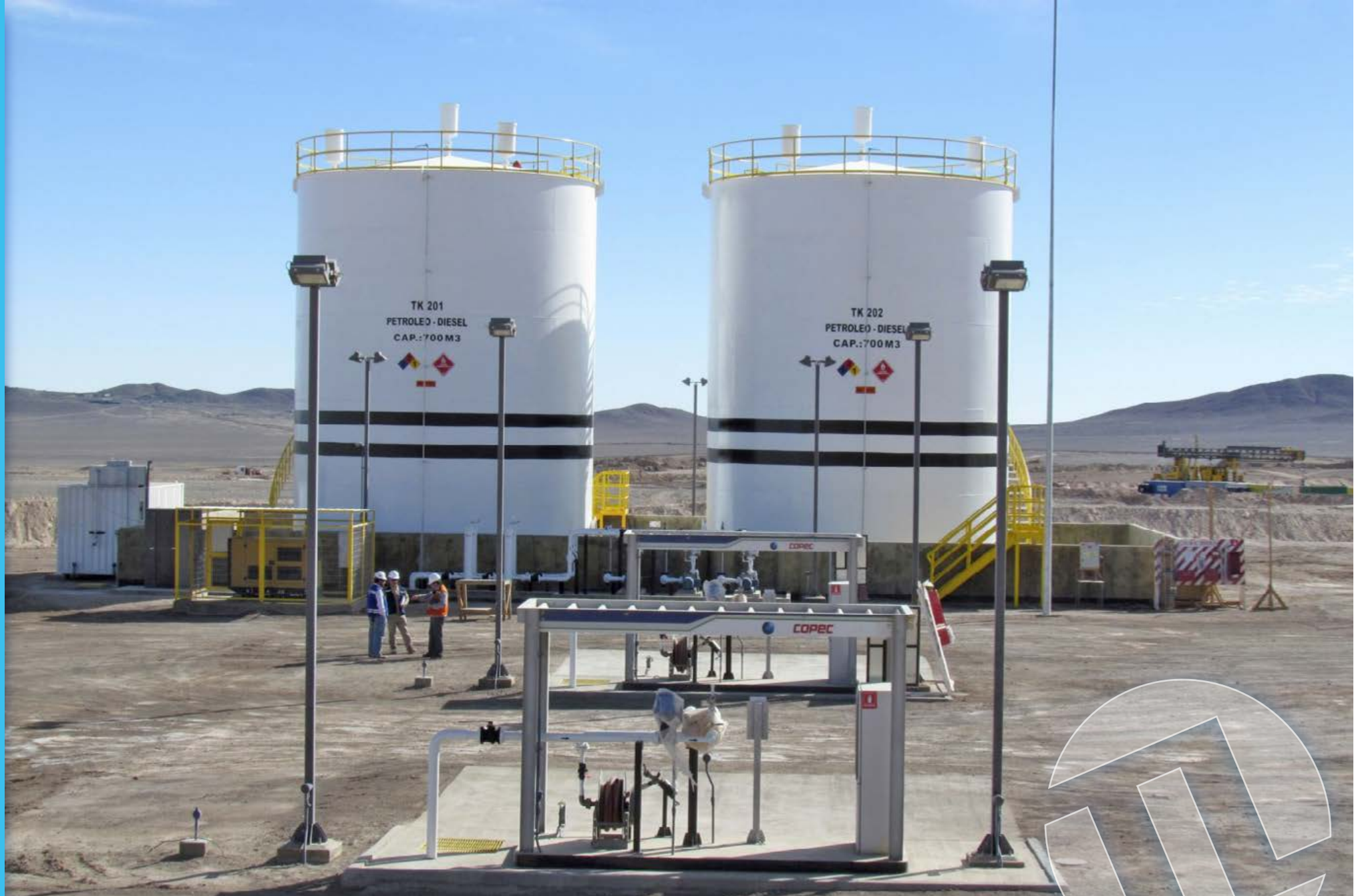
Estación de Servicios ES2, Copec, Minera Quadra