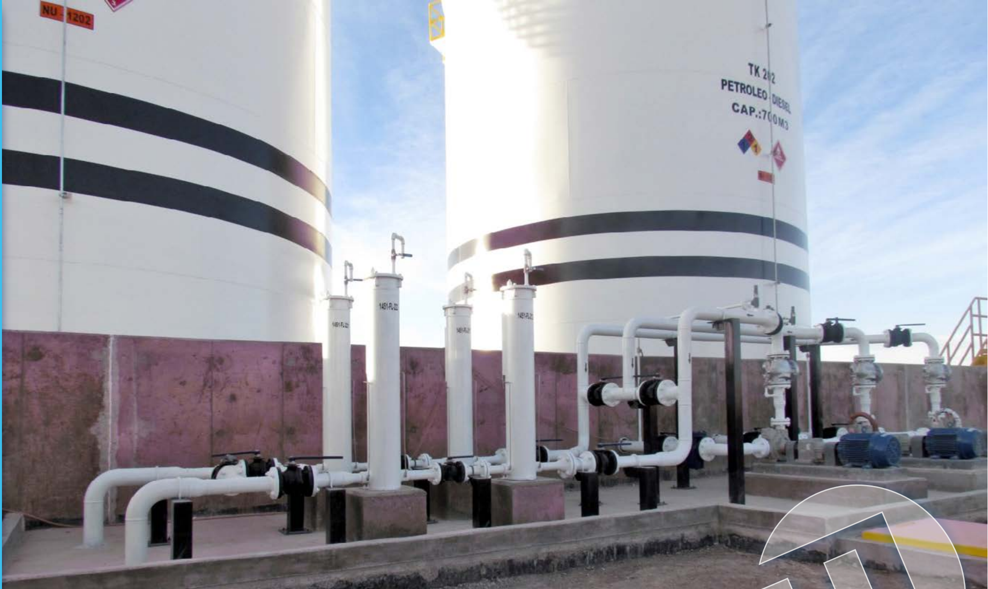
Piping ES2, Copec, Minera Quadra