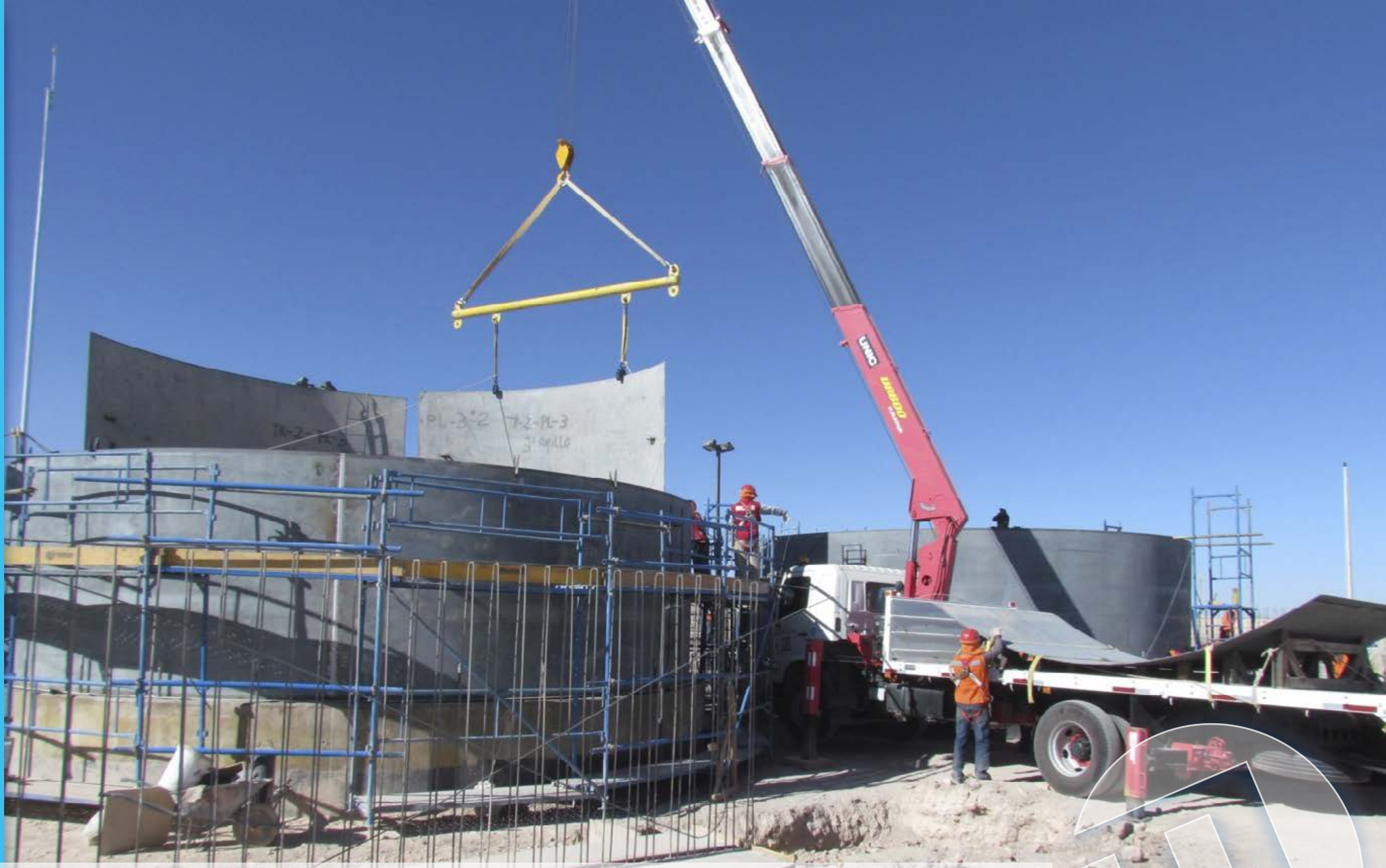
Izaje Planchas, Estanques ES2, Copec, Minera Quadra